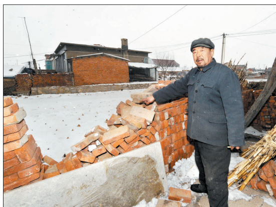
1月23日,在灯塔市柳条寨镇蒿子屯村,一位村民指示被地震震塌的房屋外墙