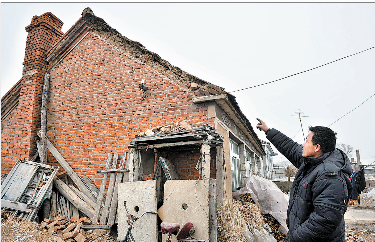
这是1月23日拍摄的灯塔市柳条寨镇树碑台村在地震中受损的房屋