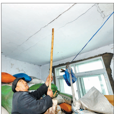
1月23日,在灯塔市柳条寨镇蒿子屯村,一位村民指示被地震震裂的房屋天花板