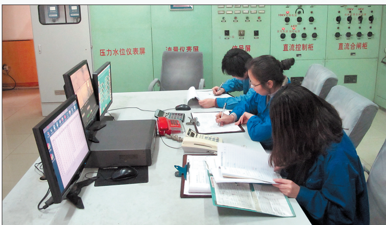
工作人员正在记录监测结果

我们看到,从水源地到水龙头,科技手段的监控协助、制度上的三级水质监测保障、硬件设施的配备、传统工艺加工手法……自来水厂原来没有秘密,现在也不敢有不为人们知的秘密。