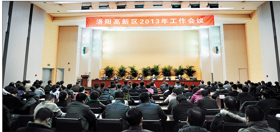
高新区2013年工作会议现场

策部署上来,坚定信心,迎难而上,抢抓机遇,科学发展,全面加快国家创新型科技园区建设步伐,努力保持经济社会发展好的态势,努力成为全市培育和发展战略性新兴产业、转变发展方式和调整经济结构的排头兵,努力走在富民强市和中原经济区建设的前列。