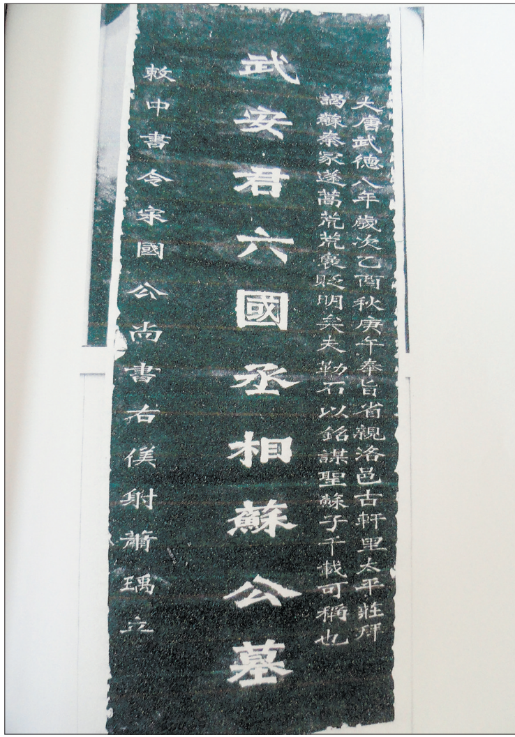
唐朝萧瑀立的“武安君六国丞相苏公墓”碑拓片

三年便宣告结束。公元前292年,齐、赵、秦三国竭力争夺宋国土地,苏秦向燕昭王献策,意图借助秦、赵之力攻破齐国,由他作为燕国特使派到齐国,以助齐攻宋为名,做间谍工作而达到破齐的目的。到齐国后,苏秦取得齐王的信任,游说齐灭宋致齐国兵力大损,后赵、魏、韩、秦、燕五国合纵伐齐。公元前284年,五国联合伐齐,苏秦作为内应,将齐国的设防情况全部向燕国将领乐毅汇报,同时劝齐王在燕国方向不要设防。乐毅率军在燕国方向发动猛攻,所到之处都没有遇到强力抵抗。乐毅的胜利,也宣告了苏秦身份的暴露。齐王震怒,将苏秦车裂。