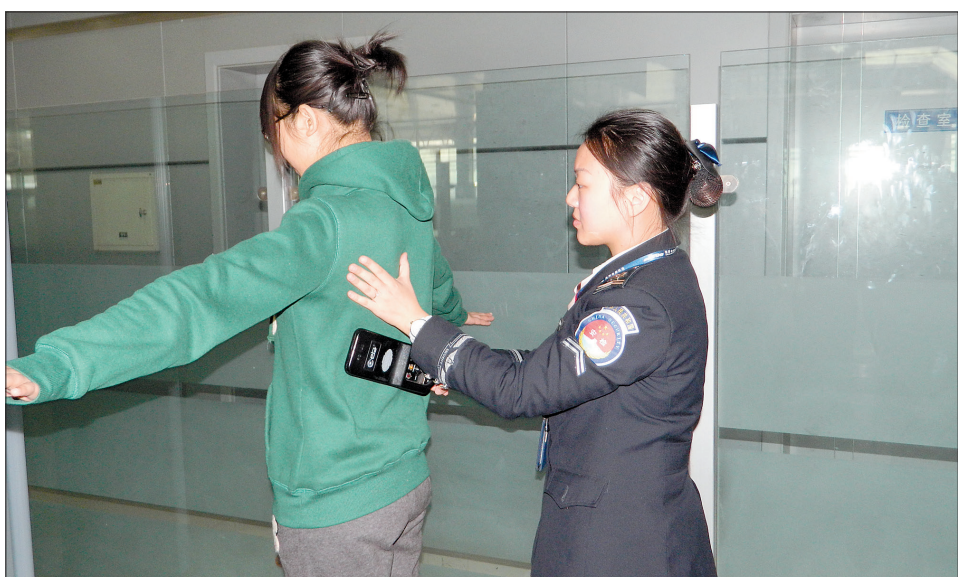
安检员正在对旅客进行检查

核心提示 他们起早贪黑,迎着清晨第一缕曙光走上工作岗位,却在夜深人静的午夜才回家;他们不辞辛劳,一次次笑脸相迎,一遍遍弯腰下蹲,只为给旅客创造一个舒适、安全的环境……近日,记者走进洛阳北郊机场,体验安检员不为人知的艰辛。