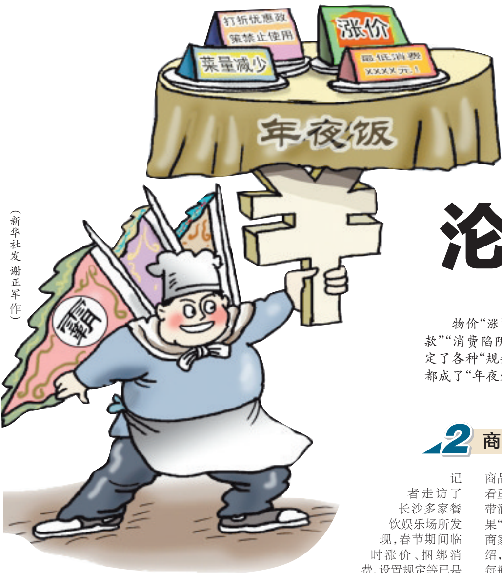
(新华社发 谢正军作)