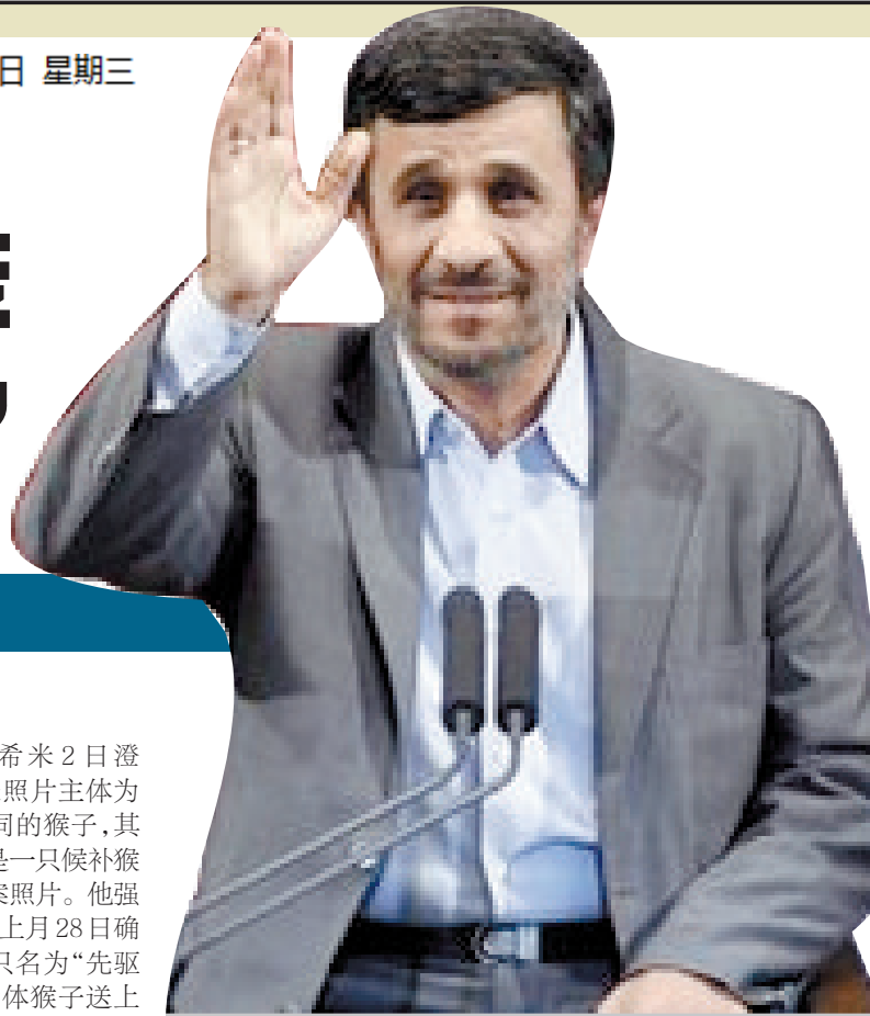
艾哈迈迪-内贾德(资料图片)

上月22日,他在场新闻发布会上开玩笑,预测一名参议院同事将在阿富汗被劫持为人质。他几分钟后再次开玩笑,说打算在约翰·克里出任国务卿的确认听证会上审问克里,应该用“水刑”让克里说实话。(新华社专电)