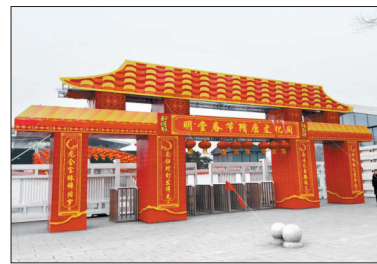
喜庆的文化周主题牌楼

本届文化周活动把传统融入现代,舞台布置凸显隋唐元素。活动设置更加注重与游客互动,具有较强的可操作性和教育意义。