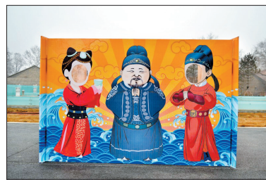
穿越回大唐,与将相合影