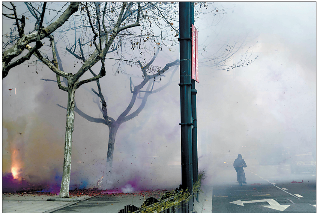
16日,行人从浙江省杭州市凤起路“开门炮”燃放后的浓烟中穿过