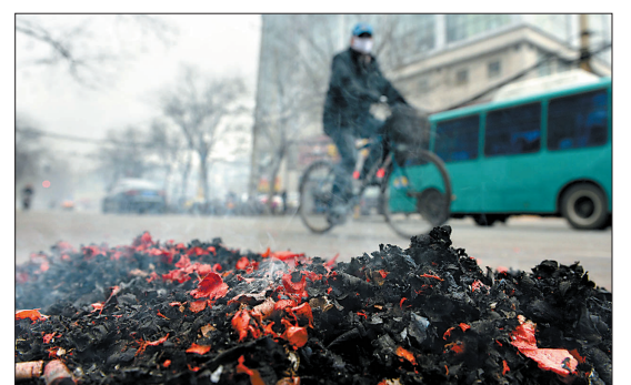
济南市众多商家为讨好北头燃放的“开门炮”抬高了pm2.5数值