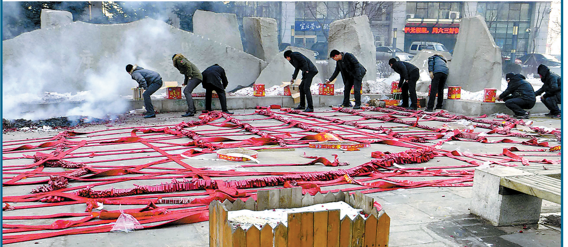
16日,在辽宁省沈阳市奉天银座广场,一家企业的员工在燃放“开门炮”