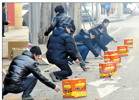
16日,辽宁省大连市一些单位的工作人员在路边燃放“开门炮”