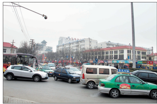
缓解交通拥堵是拆除花坛的主要目的