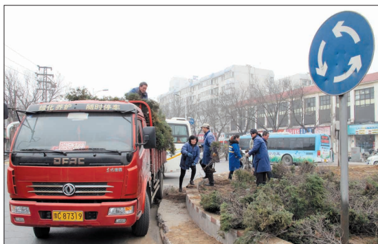
绿化工人移植花坛中的苗木

此外,东花坛路口将于近日开始封闭施工,届时启明东路、启明西路、启明南路、启明北路的车辆均需绕道行驶,周边17条公交线路将受到影响,具体运行方案将于近日确定。