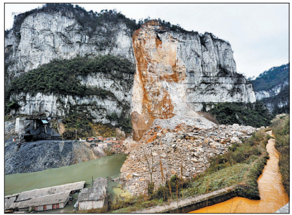
黔东南形成堰塞湖

据新华社贵州凯里2月19日电(记者 闫起磊)19日下午,在贵州省凯里山体崩塌现场,贵州省消防总队救援人员利用生命探测仪对可能埋有5名被困人员的位置进行了探测,未发现生命迹象。发生崩塌的山体以及相连周边山体仍存险情。