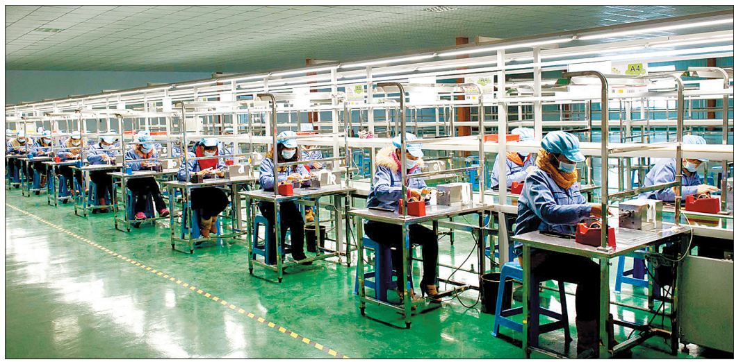
大批群众在宜阳产业集聚区实现了家门口就业

宜阳县把就业工作放在民生改善的重要位置,积极落实就业政策,注重发挥经济发展对就业的带动作用,大力开展政策帮扶和职业技能培训,全面提升劳动者就业能力和技能水平,重点解决困难群体就业,使就业工作呈现良好态势。