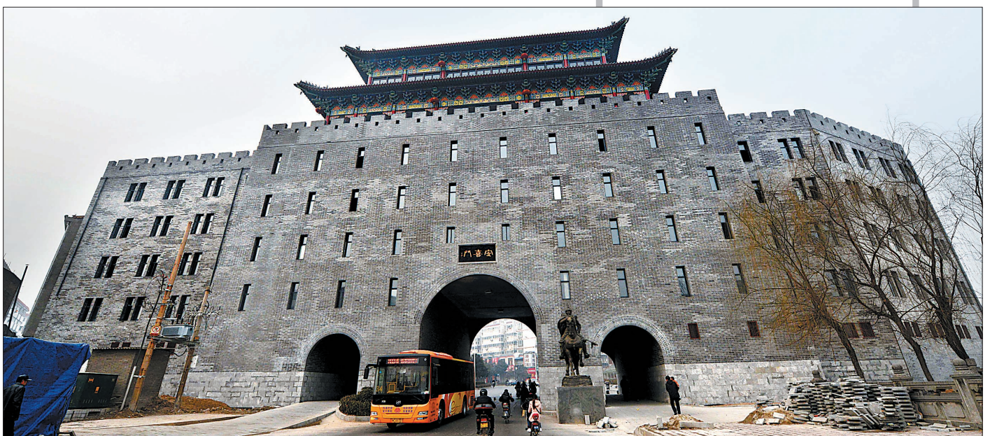
近年复建的安喜门