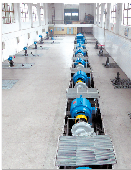
我市自来水生产设备