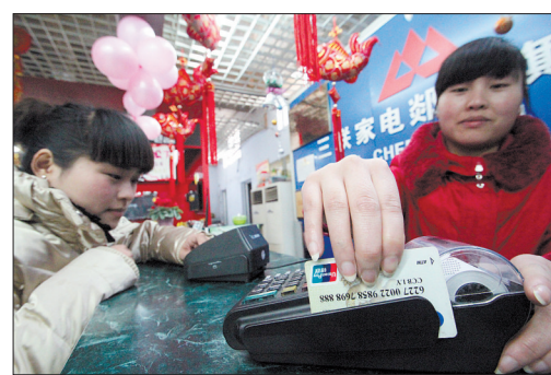
25日,山东省临沂市郯城县一家家电商场工作人员为顾客刷卡

自2月25日起,我国执行了近十年之久的银行卡刷卡手续费将实行新的费率标准,新费率较之前总体下降超过20%。