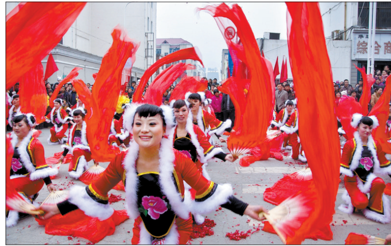
火红秧歌扭起来

该县将对惠民实事的落实加强督察,严格奖惩,年终考核将把十项惠民实事的落实情况作为对相关单位工作情况考核评价的重要依据之一,对完不成任务或完成质量较差的,将追究有关人员的责任,力争把惠民实事全部办成优质工程、民心工程、廉政工程。(李伟)