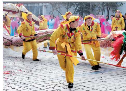
龙腾虎跃迎春到

元宵节期间,栾川县几十路民间舞蹈(故事)表演队活跃在城镇和乡间,舞龙舞狮、威风锣鼓、舞蹈秧歌等节目异彩纷呈,着实让广大群众过了把瘾。灯展、电影展映、戏曲表演、灯谜晚会等活动也极大地丰富了群众的双节生活。(石岩)