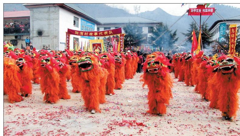
群狮起舞闹元宵