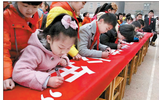
昨日,在市实验小学凯东校区的开学典礼上,学生们参与“学雷锋,争做五星美德少年”签字活动