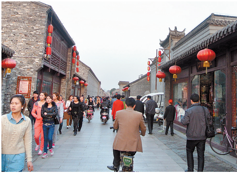
流淌着扬州文化,东关街古韵十足

日前,市国际文化旅游名城建设考察团赴山西省、江苏省、湖南省等地,考察名城建设、历史街区保护开发、文化产业发展等工作,为我市建设国际文化旅游名城寻求借鉴。本报今起推出“借鉴外地经验 助推名城建设”栏目,介绍相关经验。敬请关注。