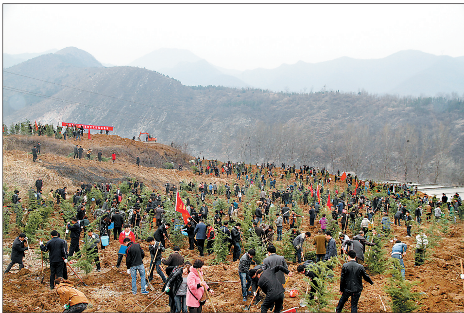
全民行动植树忙