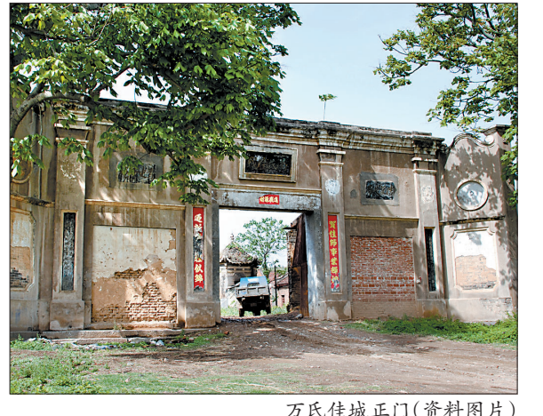
万氏佳城正门(资料图片)