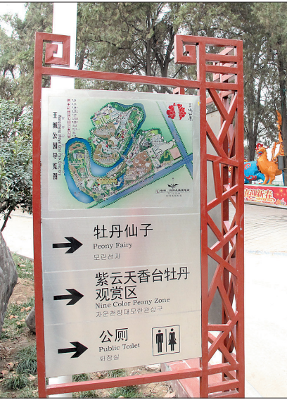
王城公园新设的指示牌

8000平方米展区、200多种名贵花木、室内室外不同观赏效果……国家牡丹园第二届中国名花展,将为本届牡丹文化节增添一抹亮色。该展出将于4月1日至15日同游客见面。结合名花展室外展区建设,该园还对北园园林道路进行改造、拓宽,新增植根花卉和小型乔木,以