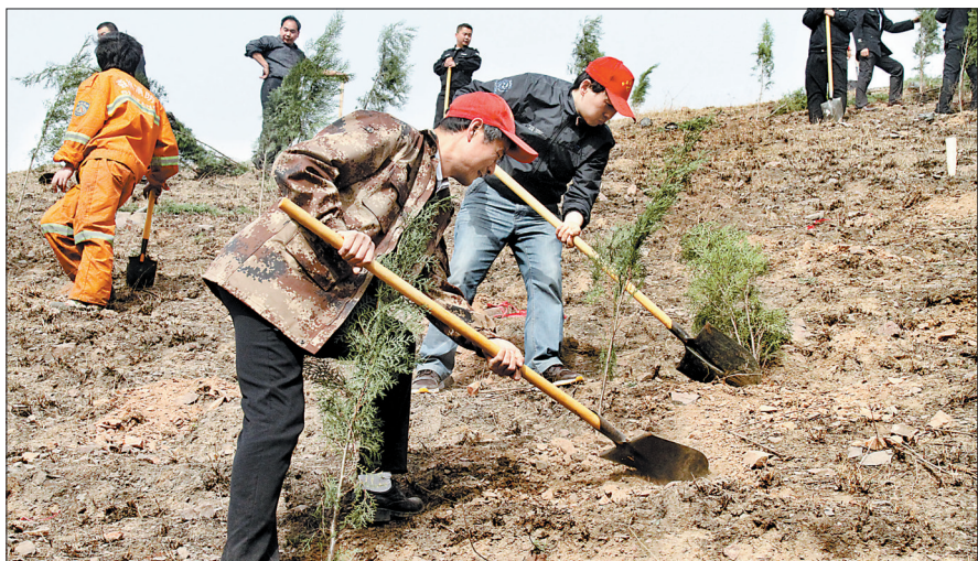
新安青年志愿者到山区开展植树造林活动

春天是一年中最美的时节,进入新安县城,人们会为扑面而来的新绿所陶醉:香樟挺拔俊秀,雪松姿态优雅……整个县城就像一个花园。