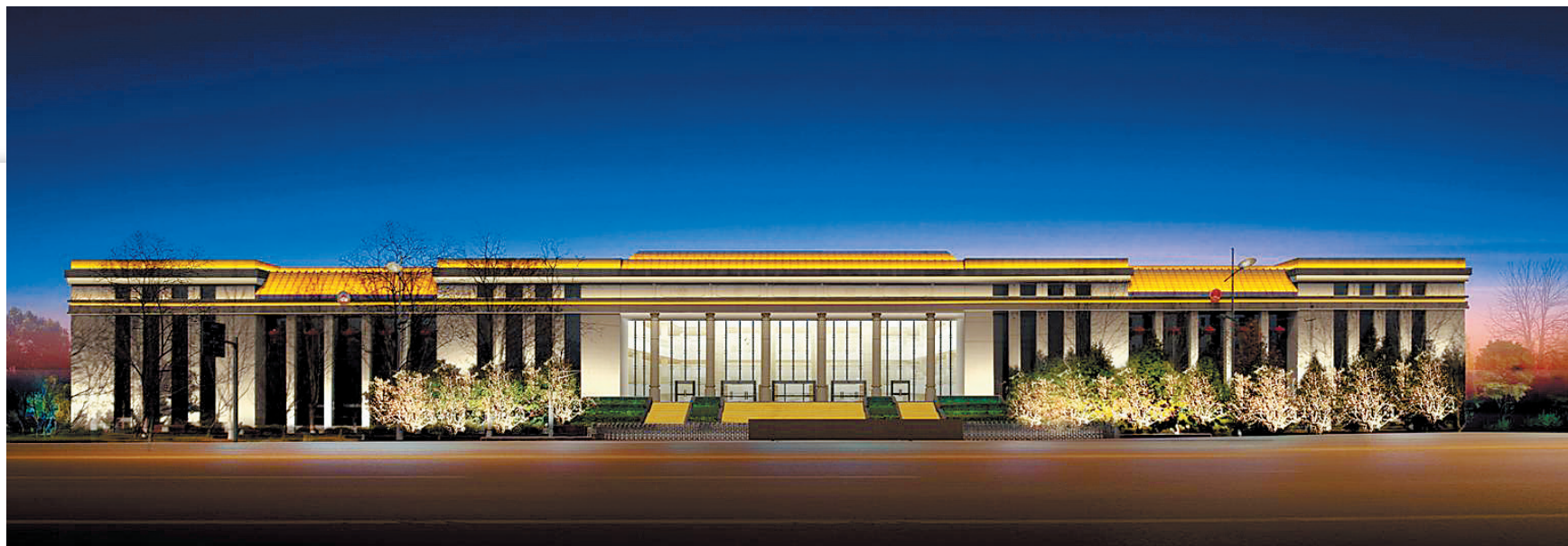
歌剧院亮化效果图