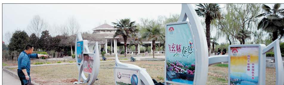
▲在城市部分公园绿地旁,公益宣传画成为亮丽的风景线