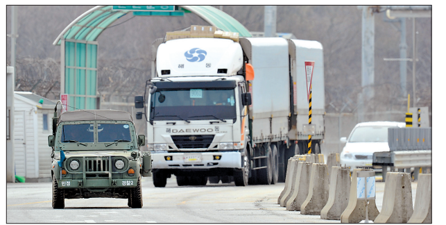
4月8日,在韩国坡州,一辆韩国军车(左)在公路上护送一辆从朝鲜开城工业园区开回来的卡车。