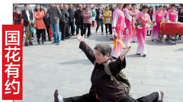
功夫老人。(7日摄于中国国花园东大门外广场)