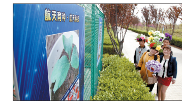
昨日,在洛阳国际牡丹园,游客驻足观看牡丹航天育种科普展。