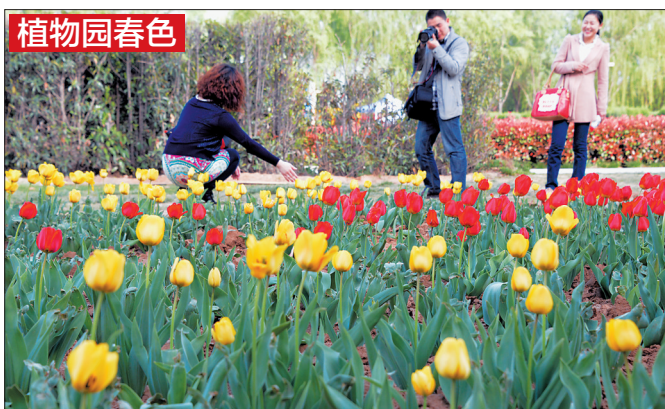
植物园春色:昨日,在隋唐城遗址植物园,盛开的郁金香让观赏牡丹的游客又停下脚步。