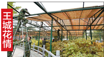
王城花情:昨日,王城公园工作人员正在搭建遮阳篷,以延长牡丹花期。