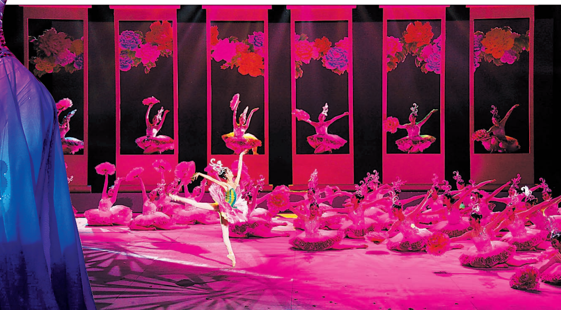
昨晚8时,第31届中国洛阳牡丹文化节开幕式晚会在洛阳歌剧院进行了首场彩排。