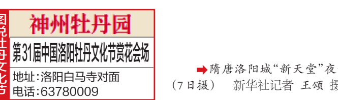
神州牡丹园 第31届中国洛阳牡丹文化节赏花会场