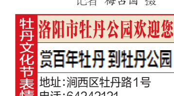
洛阳市牡丹公园欢迎您 赏百年牡丹到牡丹公园