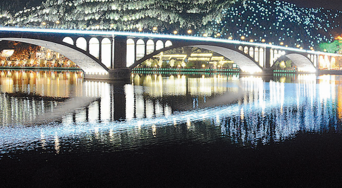
隋唐洛阳城“新天堂”夜景。(7日摄)