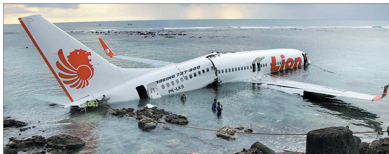
4月13日在巴厘岛冲出跑道入海的印尼狮子航空公司客机