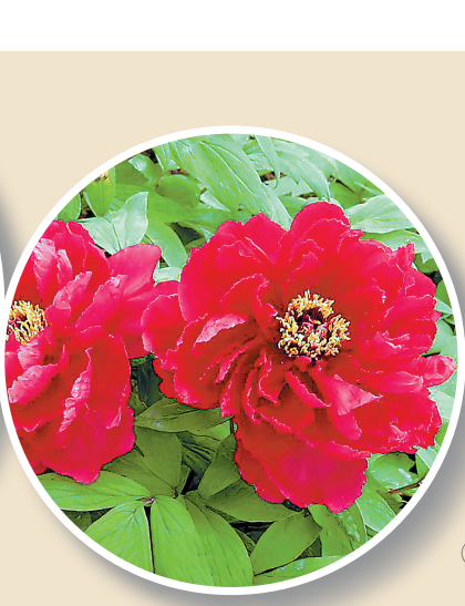
芳纪(图②) 此花鲜红色，蔷薇形，花瓣多轮，瓣基有少量紫斑；株型高大，直立；中型长叶，叶背密生绒毛，叶片宽大，黄绿色。