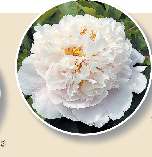
玉玺映月(图③) 此花为中间花品种，皇冠形，有时呈托桂形；花淡黄色；株型中高，枝硬；中型圆叶，叶面黄绿色；成花率高。