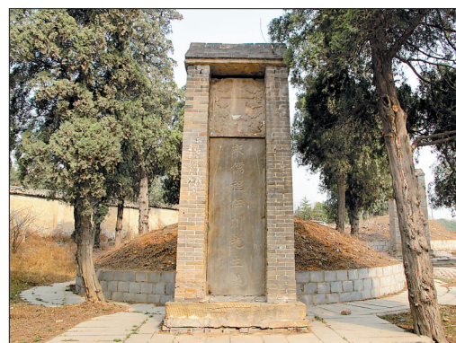
伊川先生程颐墓碑