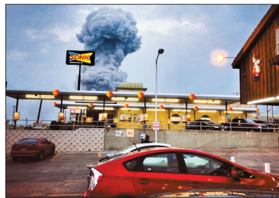
化肥厂爆炸产生浓烟