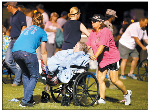
一位老人被转移到当地学校