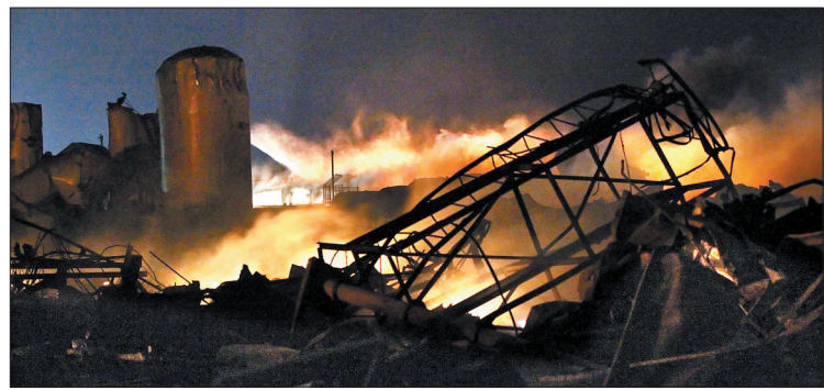
爆炸发生后的化肥厂