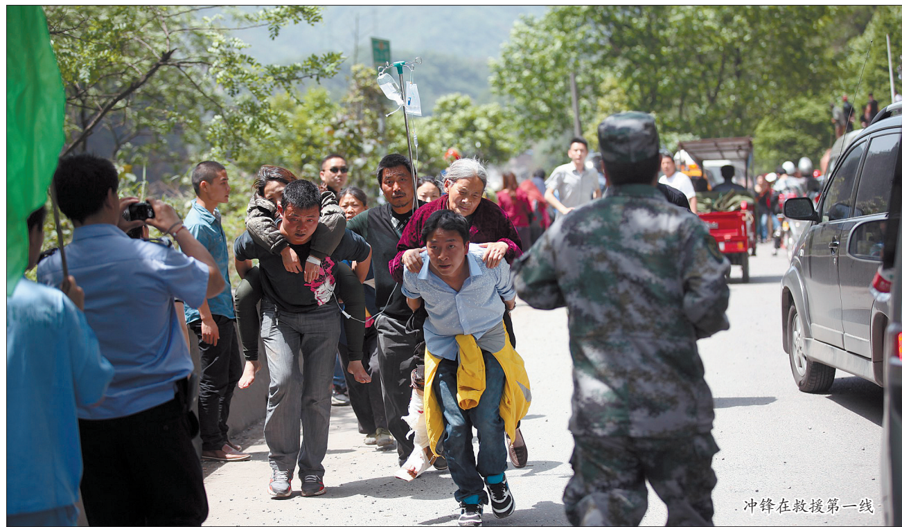
冲锋在救援第一线

20日上午8时2分,四川省雅安市芦山县发生7.0级地震。强震发生时,本报记者正在德阳市什邡市进行“5·12汶川地震五周年”回访。地震发生后,记者第一时间赶往地震灾区芦山县。