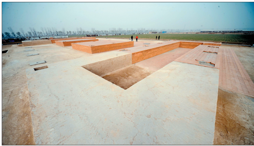
汉魏故城端门遗址保护展示工程

洛阳生态环境优越,栾川、嵩县是享有盛名的生态旅游目的地,旅游资源丰富。作为十三朝古都,洛阳人文历史资源丰富且具有很高的品质——此为天时。 经过多年的培育和发展,洛阳丰富的旅游资源被不断开发出来。洛阳现