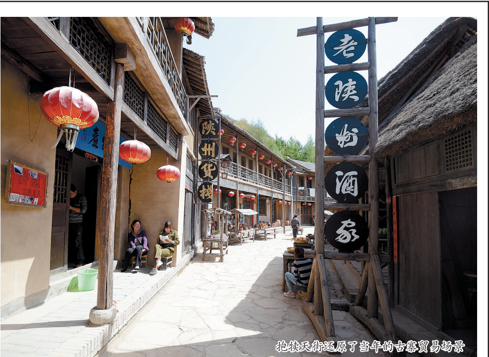
抱犊寨街还原了当年的古寨贸易场景