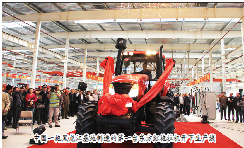
中国一拖黑龙江总装制造的第一台东方红拖拉机开下生产线