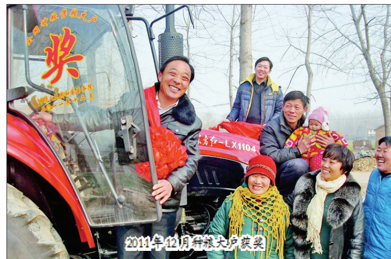
2011年12月种粮大户颁奖

持续加大强农惠农富农的政策机遇下,中国一拖迎来了更加广阔的发展空间。面向未来,中国一拖将全面贯彻落实党的十八大精神,坚持科学发展,紧紧围绕创新发展这条主线,聚焦能力建设、深化“聚核铸强”发展战略,为加快推进“六加一”攻坚战、奋力实现富民强市总体目标发挥更大的作用,为洛阳经济腾飞做出更大的贡献。(韩冰)