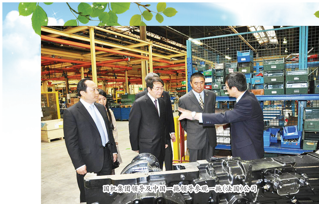
国机集团领导及中国一拖领导参观一拖(法国)公司