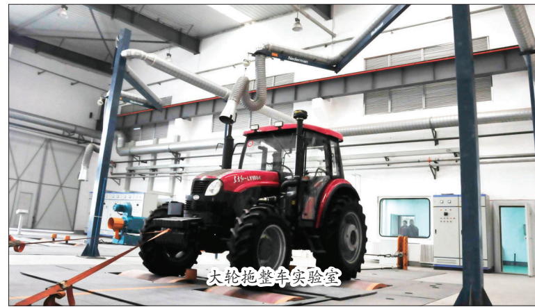
大轮拖整车实验室