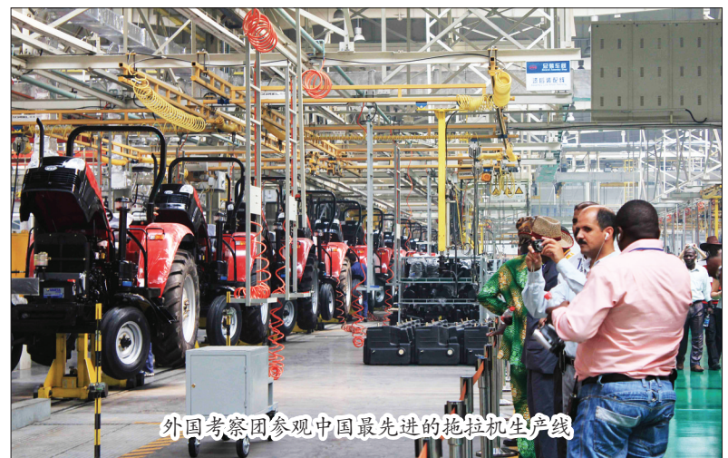
外国考察团参观中国最先进的拖拉机生产线