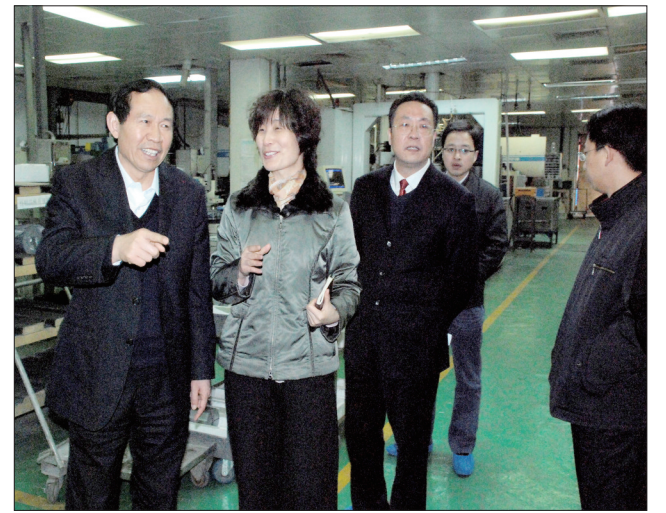
省有关领导在企业视察工作

凤凰涅槃,创新发展。洛单人决心立足新起点,开创新局面,秉承“乐于担当 忠诚使命”的公司精神,2013年的目标是实现主营业务收入7.93亿元,安全零事故,经营零风险,廉政零案件,企业搬迁与项目运作取得阶段性重大突破,力争完成项目投资5亿元,高标准设计,高质量建设,把握时间节点,倒排工期,推进项目建设进度,为我国信息产业的腾飞和国防事业的强盛、为中原经济区建设、为洛阳的发展做出新贡献!(王经岭 王颖)