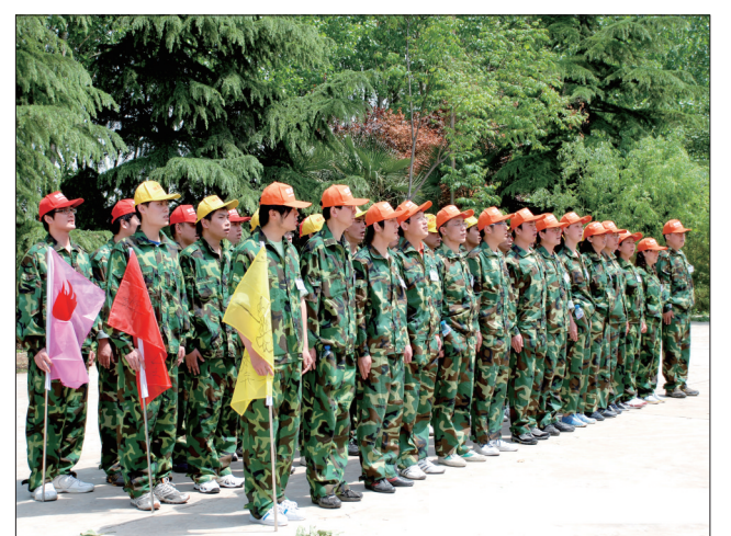
开展拓展训练 打造优秀团队