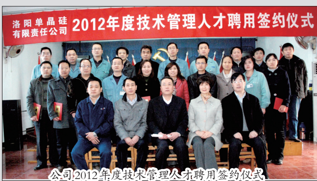
公司2012年度技术管理人才招聘签约仪式