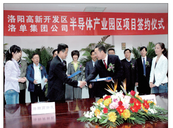
洛阳高新区洛单公司半导体产业园区项目签约仪式