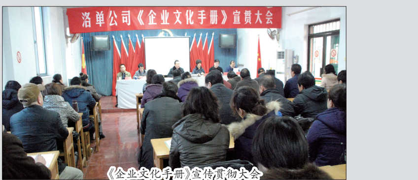
《企业文化手册》宣传贯彻大会