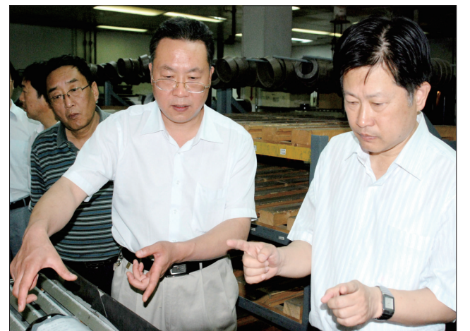
公司董事长陪同领导参观