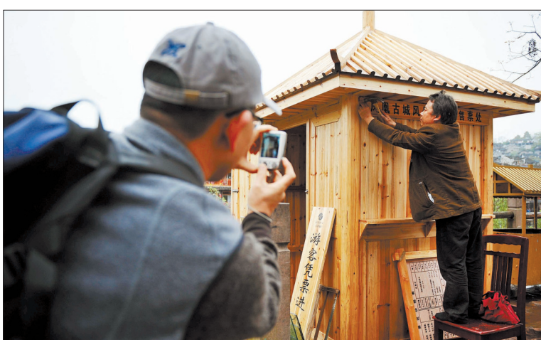
四月九日,一名工作人员在凤凰古城一处收费点安装标志牌