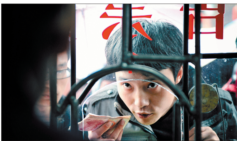
四月十日,一名导游在凤凰古城一处售票点购买门票