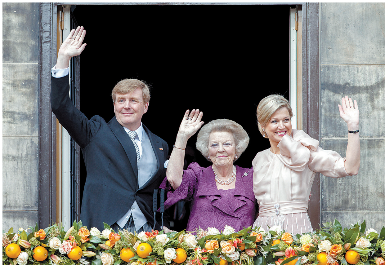
4月30日,刚刚退位的荷兰女王贝娅特丽克丝(中)与继位的荷兰国王威廉·亚历山大及其王后马克西玛在阿姆斯特丹王宫阳台上向民众挥手致意

威廉-亚历山大与马克西玛2002年2月结婚,两个人育有3个女儿。(据新华社荷兰阿姆斯特丹4月30日)