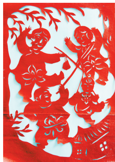
剪纸作者 畅畅 篆刻作者 耿红霞