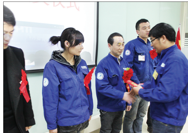
周例会上给明星员工颁奖