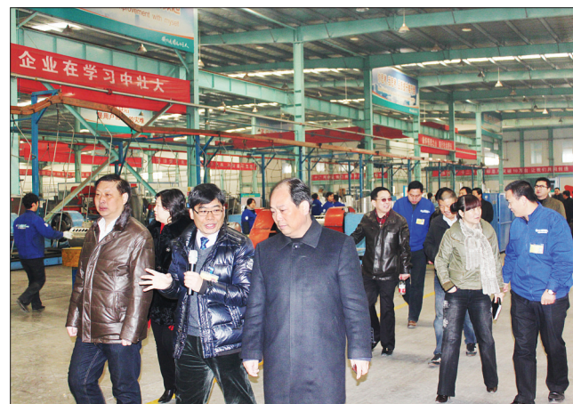
市人大代表在企业参观