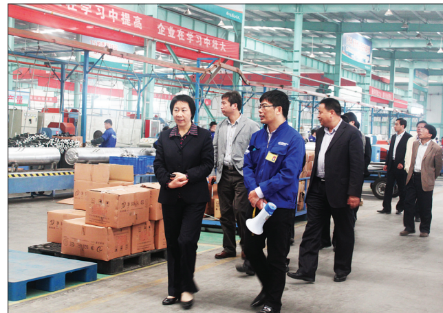
给参观团讲解热水器生产过程