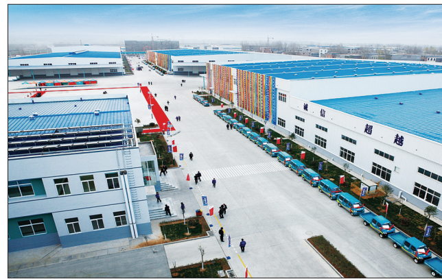
四季沐歌(洛阳)太阳能工业园一角