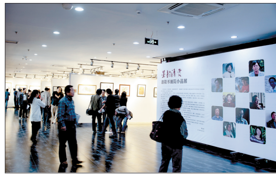
“墨韵清赏”书画小品展览现场