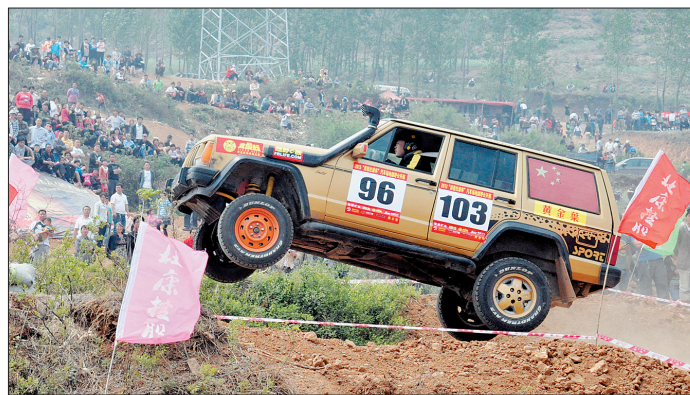
腾空飞跃

赛车轰鸣,带给车手和现场观众的不仅是速度和力量背后的越野豪情,同时也是绝妙的视觉冲击和美的精彩释放。越野赛举办期间,千余名摄影爱好者用镜头定格了一幅幅用激情诠释的瞬间。