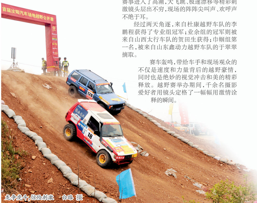
龙争虎斗,惊险刺激 白路摄

汝阳县副县长赵书政表示:“当下,汝阳旅游业正处在加速发展阶段。多姿多彩的旅游资源以及鲜明的地域特色和文化特色,通过与户外运动项目相结合,必将形成推动全县旅游业加快发展的强大动力,汝阳旅游也必将展现自己独特的魅力。”(白路)