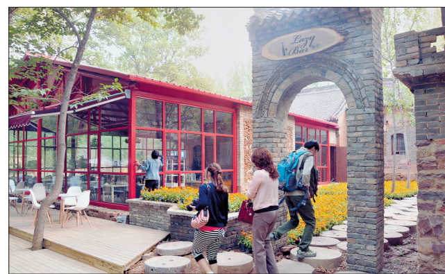
大虎岭户外运动基地一角