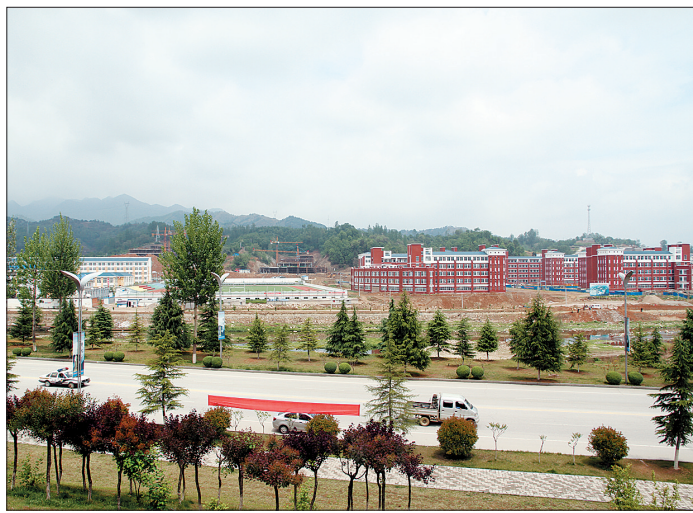
即将全面投用的栾川一高新校区

迎宾大道、南环路等交通项目,近期将全面竣工;新区医院、文化艺术中心、公共卫生服务中心等项目稳步推进,上半年将建成投用;第四水源、第二污水处理厂等项目正在加快建设,有望年底前竣工投用;职工健身中心、东岭植物园等项目,也在加紧施工。