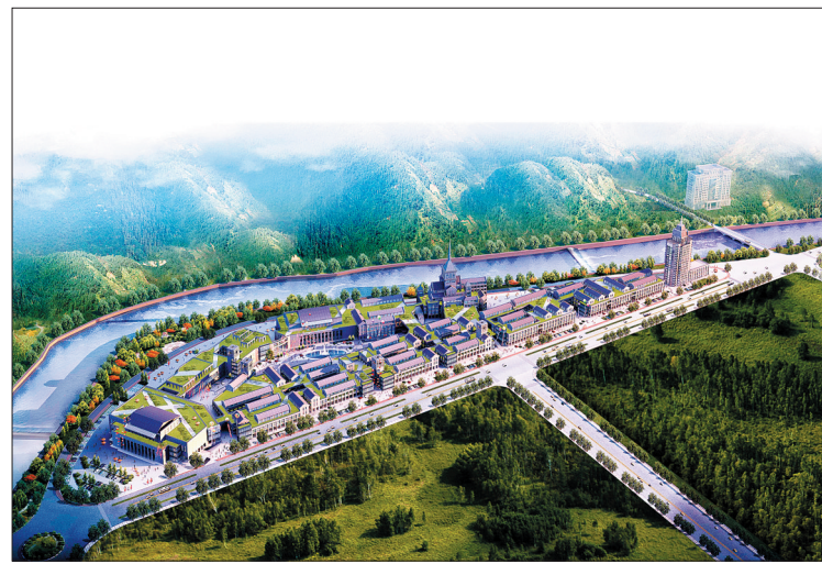
凤凰天街商业综合体效果图