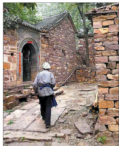
错落有致的石头民居