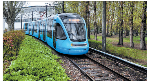
5月10日,中国首列具有完全自主知识产权的商用100%低地板现代有轨电车在中国北车长春轨道客车股份有限公司下线。