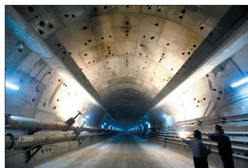
国内掘进距离最长、埋深最深、水压最高、直径最大的地铁过江隧道——南京地铁10号线过江隧道10日贯通。