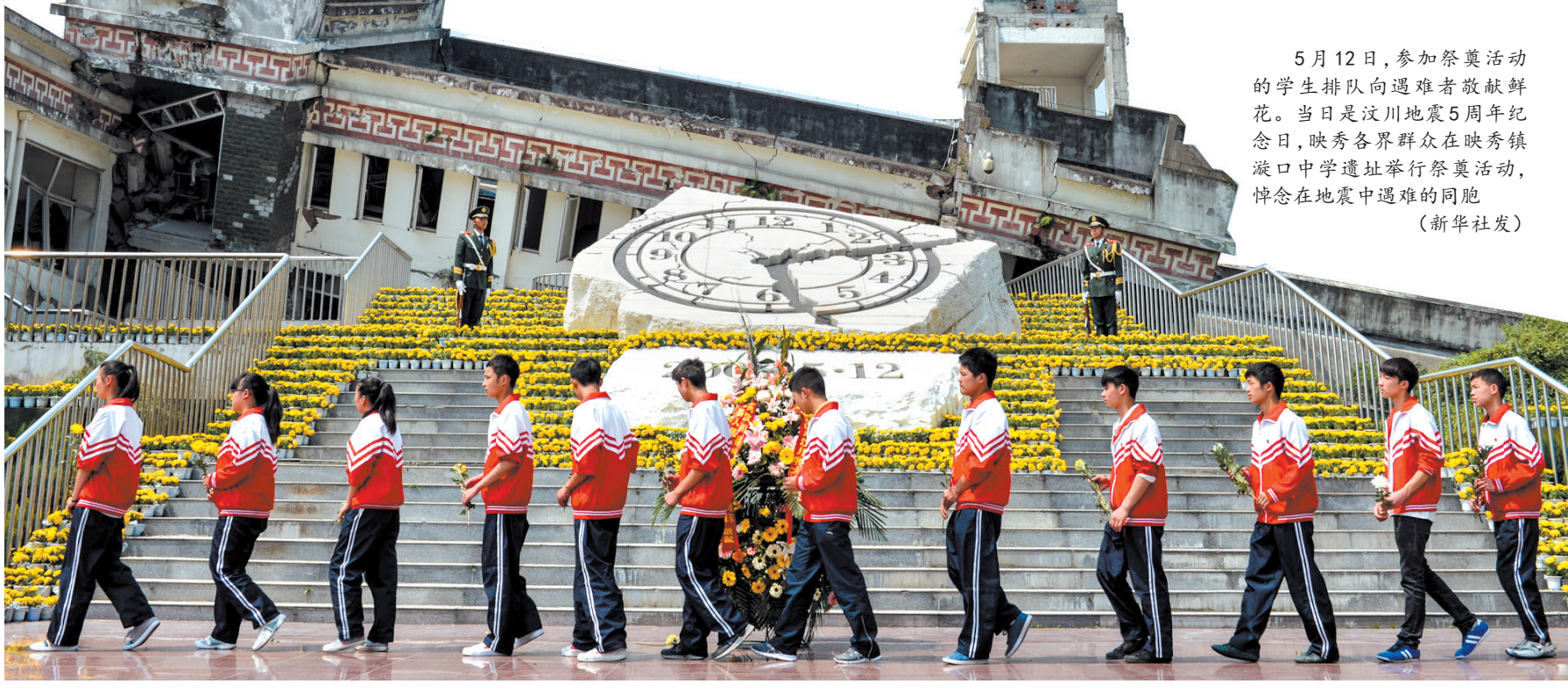
5月12日,参加祭奠活动的学生排队向遇难者敬献鲜花。当日是汶川地震5周年纪念日,映秀各界群众在映秀镇漩口中学遗址举行祭奠活动,悼念在地震中遇难的同胞。 (新华社发)