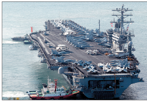
这是抵达韩国釜山的美国核航母“尼米兹”号。

韩美联合司令部11日确认,美国海军“尼米兹”号核动力航空母舰及其战斗群当天抵达韩国,参加韩美海军“常规”联合演练。朝鲜方面当天指责,韩美举动助推地区紧张局势。