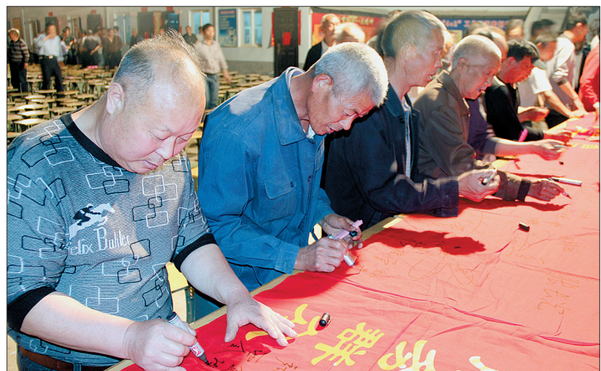
图为西庞村群众在长卷上签名。