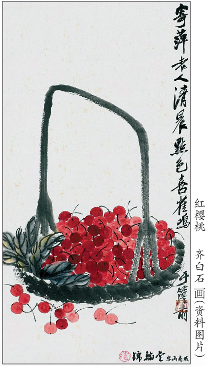
齐白石画(资料图片)

洛阳樱桃甲天下。如何扩大樱桃种植面积,发展樱桃文化产业,是我们应该认真思考的问题。