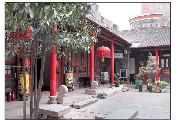
吴佩孚司令部旧址一隅