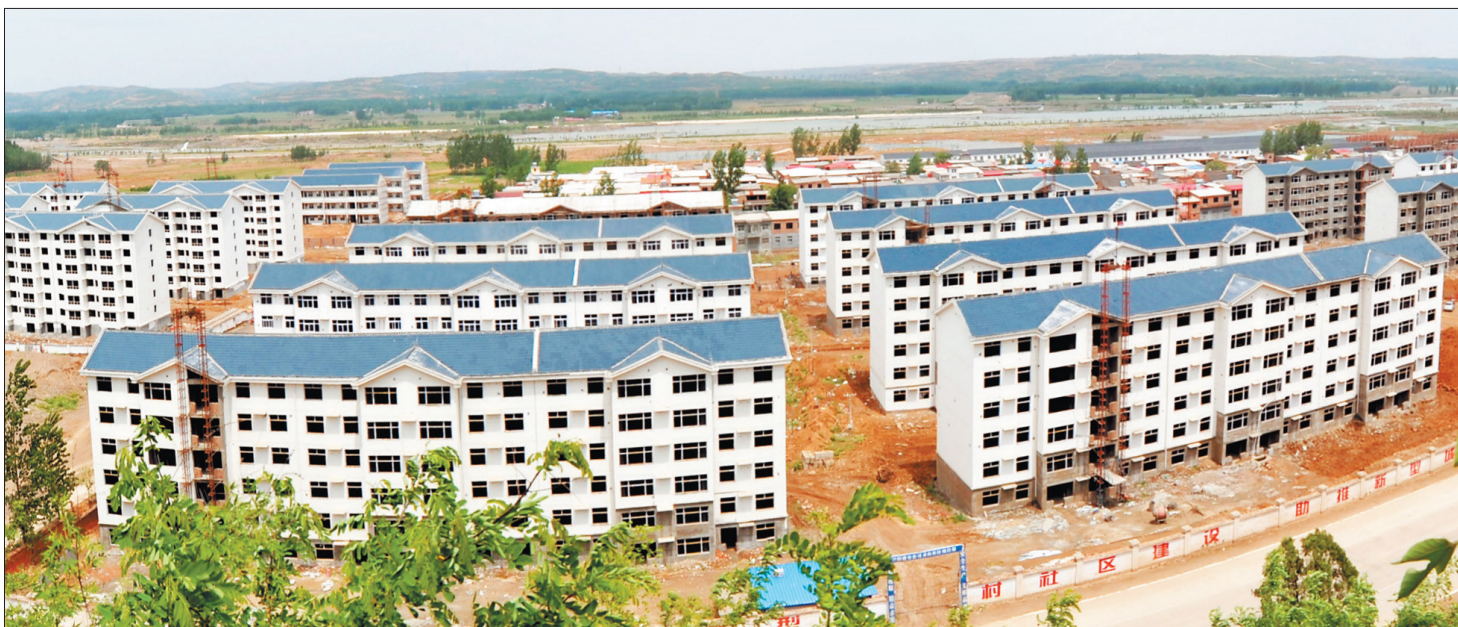
搬迁扶贫与旅游开发相结合而兴建的宜阳灵山新村

该县在整村推进扶贫工作中,注重夯实贫困村基础设施,提高贫困群众的生产生活水平。集中力量着力抓好重点贫困村的安居、基本农田、人畜饮水、乡村道路、通电等工程建设。几年来,全县共整修乡、村组道路472公里;架设低压线路5.6公里;修建校舍2.1万平方米;新建沼气池3730座、连锁超市35个;解决6800户贫困户的饮水难问题;建成了集文化、娱乐于一体的社区服务中心38个。通过项目实施,贫困地区的的基础设施发生了重大变化,贫困群众的生产生活条件明显改善。