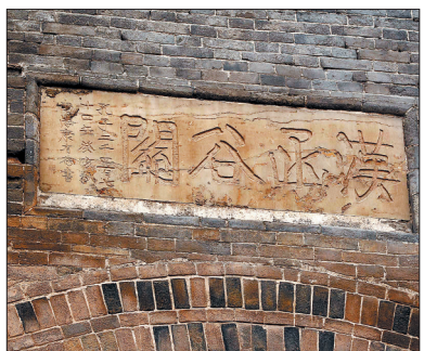
康有为题写的汉函谷关关名