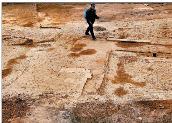
在遗址西南侧,发现了成组的汉代房屋基址