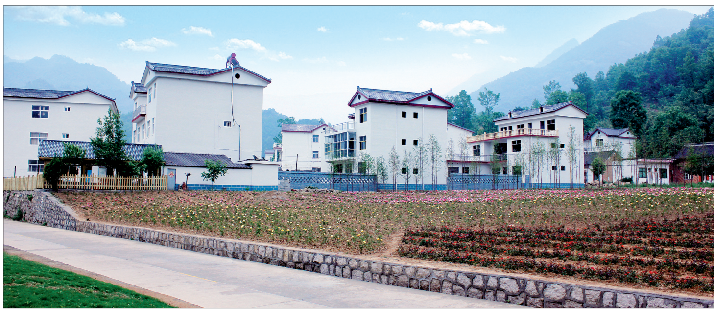
栾川县庙子镇庄子村、卡房村的生态园清新亮丽

通过发展乡村旅游,栾川县旅游产业规模不断扩大,实现了生态资源和农业资源的倍增效益。游客接待量由2000年的20万人