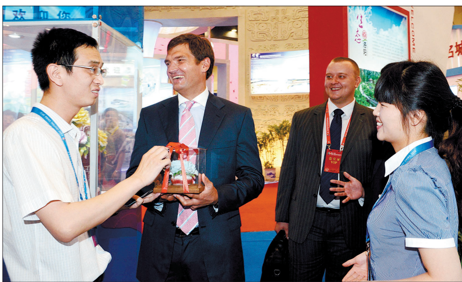
洛阳牡丹瓷股份有限公司职工(左一)向萨莫特卡尔(左二)赠送牡丹瓷