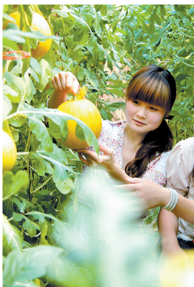
市民采摘袖珍西瓜